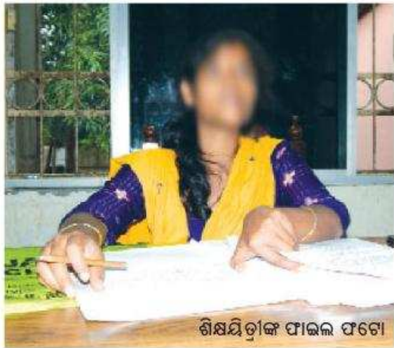
ଶିକ୍ଷୟିତ୍ରୀଙ୍କ ଫାଇଲ ଫଟୋ