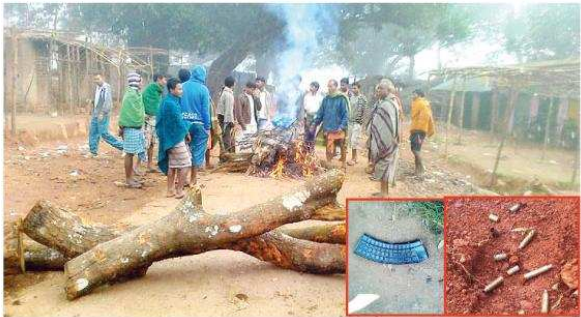
ଗ୍ରାମବାସୀଙ୍କ ରାସ୍ତାରୋକ (ଇନ୍‌ସେଟ୍) ଘଟଣାସ୍ଥଳରେ କ୍ୟାବ୍ରିଲ୍ ଓ ଖୋଜା ପଡ଼ିଛି